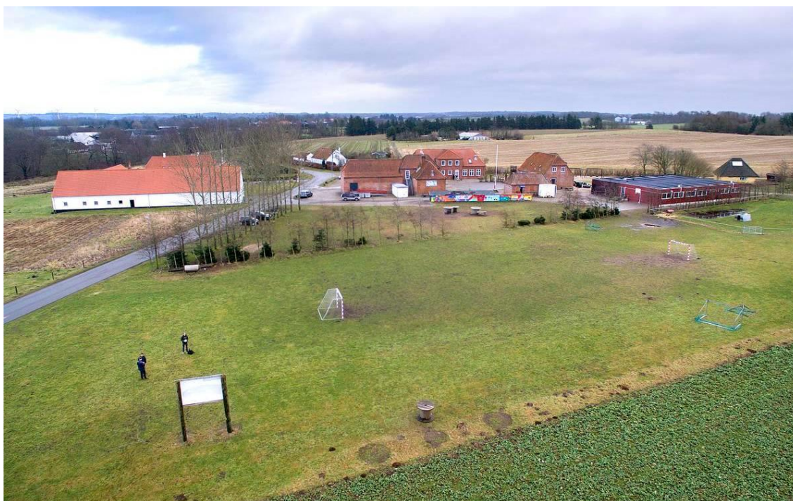
Området ved Gjerndrup Friskole 2016