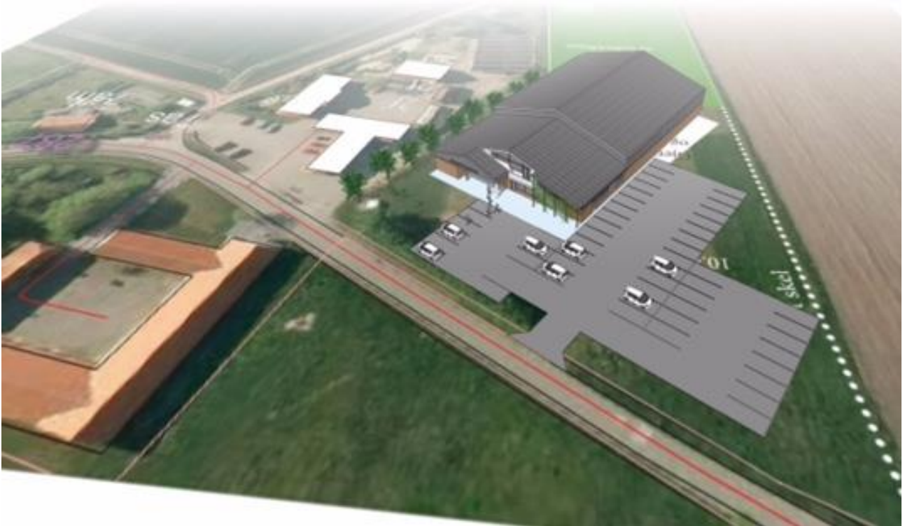
Området ved Gjerndrup Friskole 2019